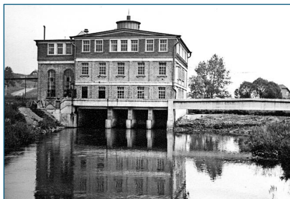
Wupperwehr beim Turbinenhaus