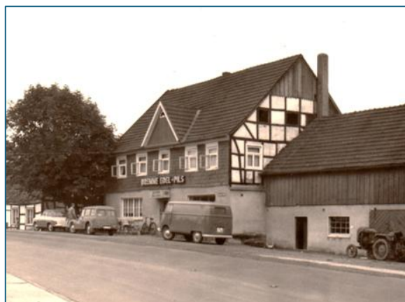
Ehemalige Gaststätte Schmitz, Wipperhof