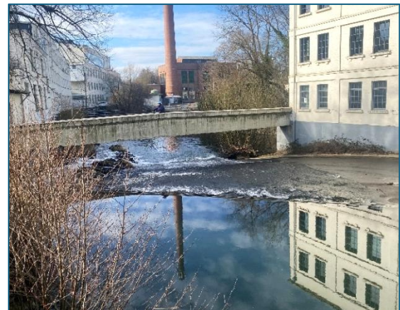
Wupperwehr und Turbinenhaus – 100 Jahre liegen zwischen diesen beiden Fotos

Wenn sich jemand für den Abbruch der Nikolauskirche aussprechen würde, müsste er sich wohl die Frage gefallen lassen, ob er noch ganz gescheit sei. Natürlich ist die Steinaufschüttung im Flussbett kein architektonisch gestaltetes Bauwerk, aber man muss sich vor Augen halten, dass sie nicht erst mit dem Turbinenhaus entstand,