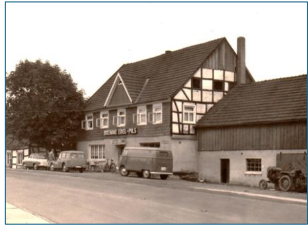
Gaststätte Schmitz, Wipperhof, links 1928, rechts um 1960; der für die Erbauungszeit typische Frontgiebel ist damals noch erhalten

Wipperfürth verdankt seine historische Entwicklung dem Zusammentreffen mehrerer Handelsstraßen, die hier den Fluss durch- bzw. überquerten. Sie verliefen in der Regel über die Höhen und waren oft als Hohlwege ausgebildet, die nur für einachsige Karren passierbar waren. Eine enorme Verbesserung der Bedingungen für Transport und Verkehr bedeutete die Anlage von „Kunststraßen“ während der napoleonischen Herrschaft. Diese verliefen auf aufgeschütteten Trassen überwiegend durch die Täler, so auch die 1812 fertiggestellte Straße zwischen Hückeswagen, Wipperfürth und Ohl (heute B 237). Die Verlagerung des Verkehrsflusses hatte ein Gaststättensterben entlang der alten Routen zur Folge, dafür gab es zahlreiche Gründungen von Bewirtungs- und Beherbergungsbetrieben an den neuen Straßen, auf denen ab 1815 auch die Postkutsche verkehrte. In diesen Kontext gehörte auch die ehemalige Gaststätte Schmitz am Wipperhof, die jetzt vom Abbruch bedroht ist.