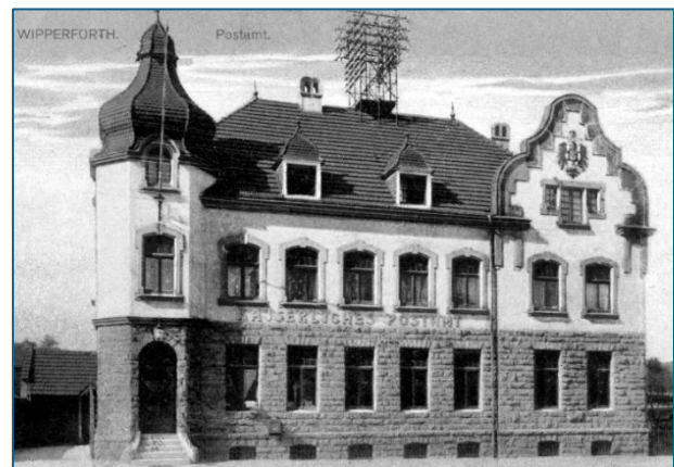
Das „Kaiserliche Postamt“ an der Bahnstraße war ein beliebtes Ansichtskartenmotiv