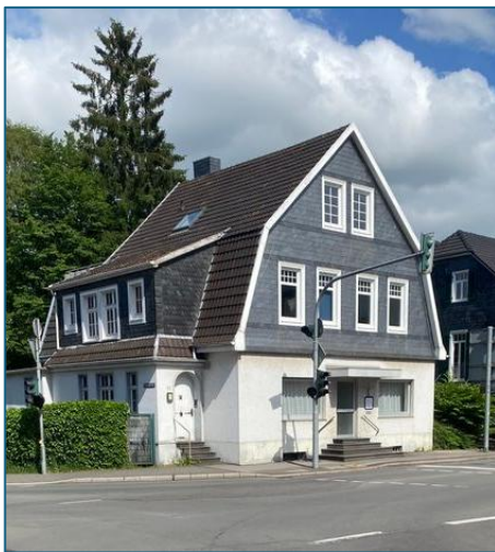
Das Haus Gaulstraße 11 heute