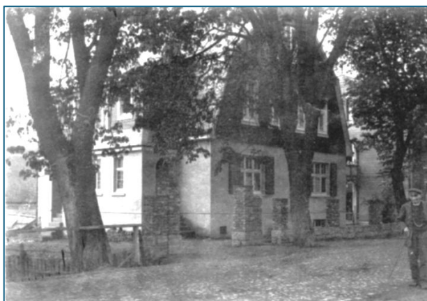
Haus Gaulstraße 11

HERAUSGEGEBEN IM AUFTRAG DES HEIMAT-UND GESCHICHTSVEREINS WIPPERFÜRTH E.V. VON DR. FRANK BERGER UND ERICH KAHL